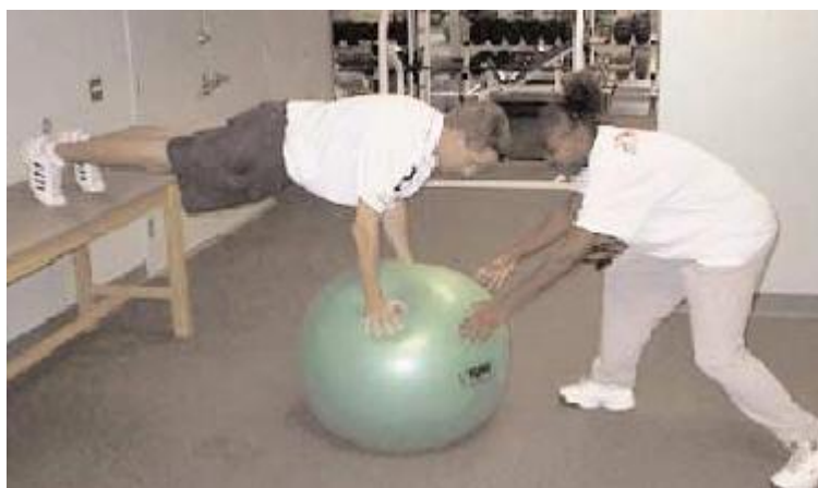
Figura 2. Estabilización de los músculos del torso, utilizando el balón de equilibrio.